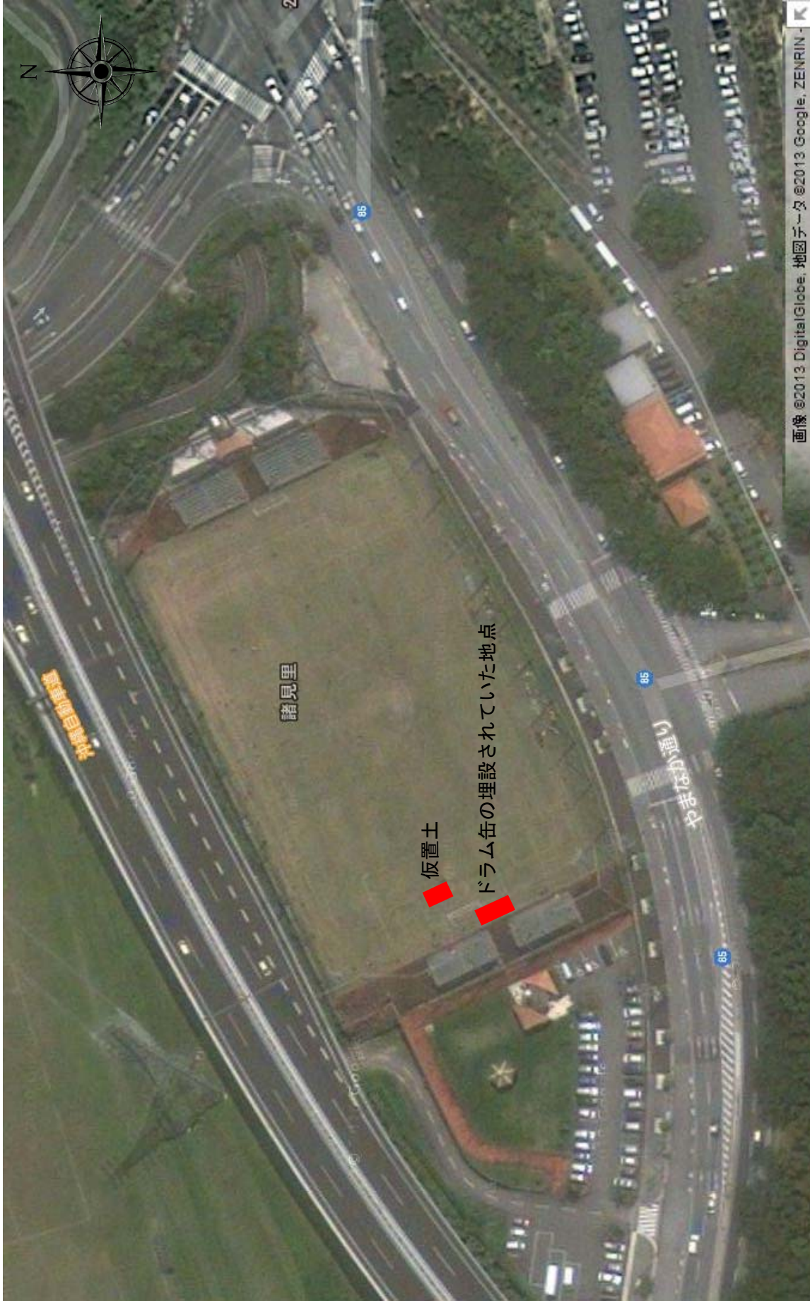
図 2-2 調査位置図